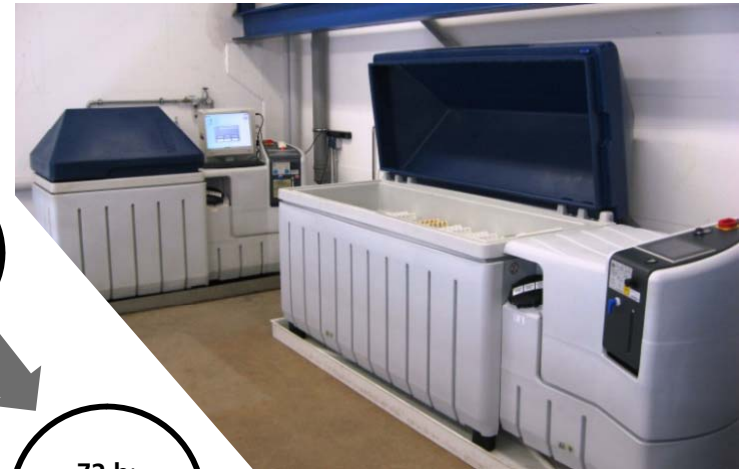
Prüfkammern SC/KWT 450 (links) und SC/KWT 1000 (rechts)